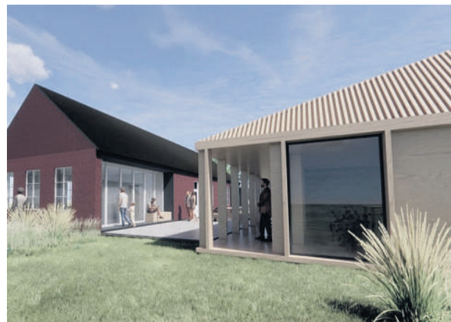
"Arrene" i hovedbygningen efter tilbygningerne omdannes til vinduespartier. Visualisering: Kronhede Lejrskole