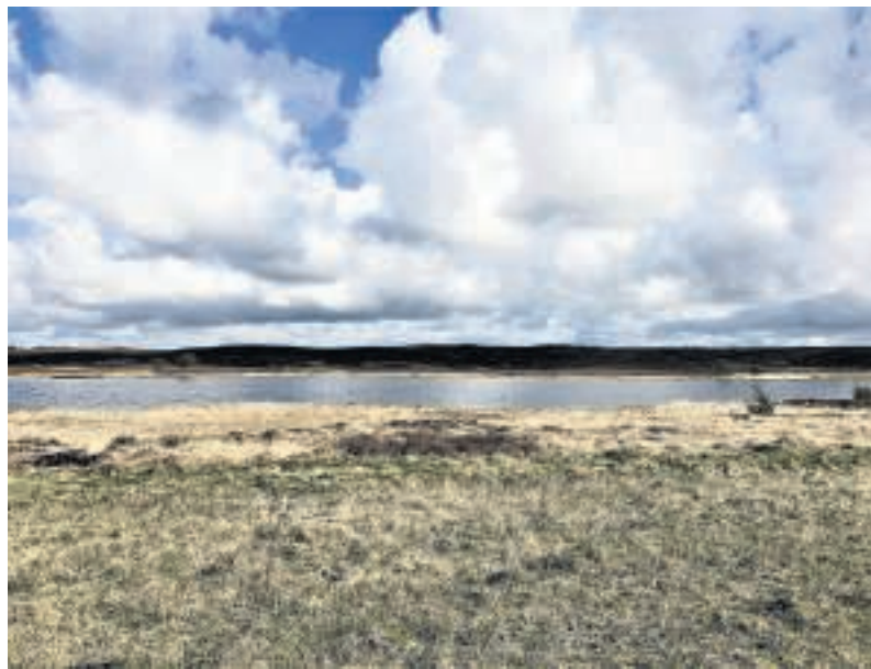
Landskabet i Stråsø imponerer igen og igen ved sin storslåethed.