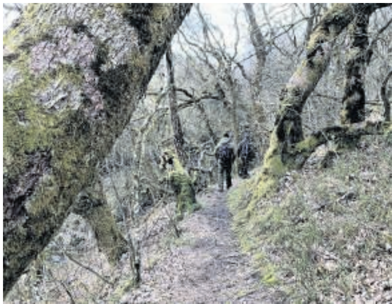
Den maleriske "troldeskov" langs Lilleå er et af Gosmerrutens højdepunkter.