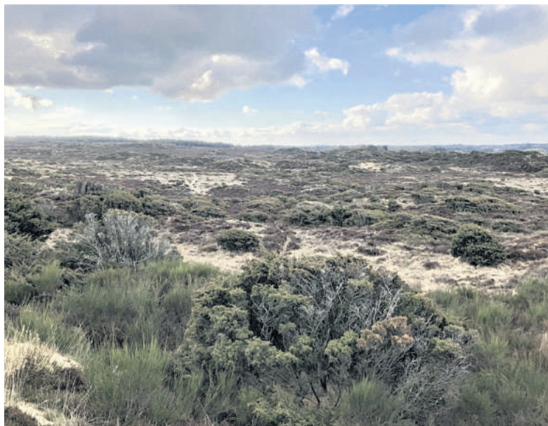
Mindre end en halv times kørsel nord for Ringkøbing og syd for Holstebro finder du dette urgamle landskab, der indtil for få år siden var lukket, fordi det var urfuglereservat. Nu har vi alle glæde af det.