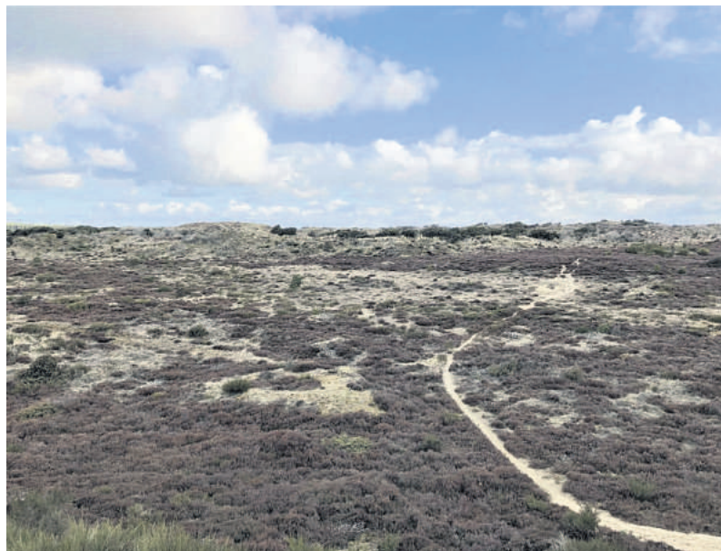
Der mangler bare lige en lille fårehyrde, så er Sdr. Vosborg Hede den perfekte kulisse til en Blicher-novelle.