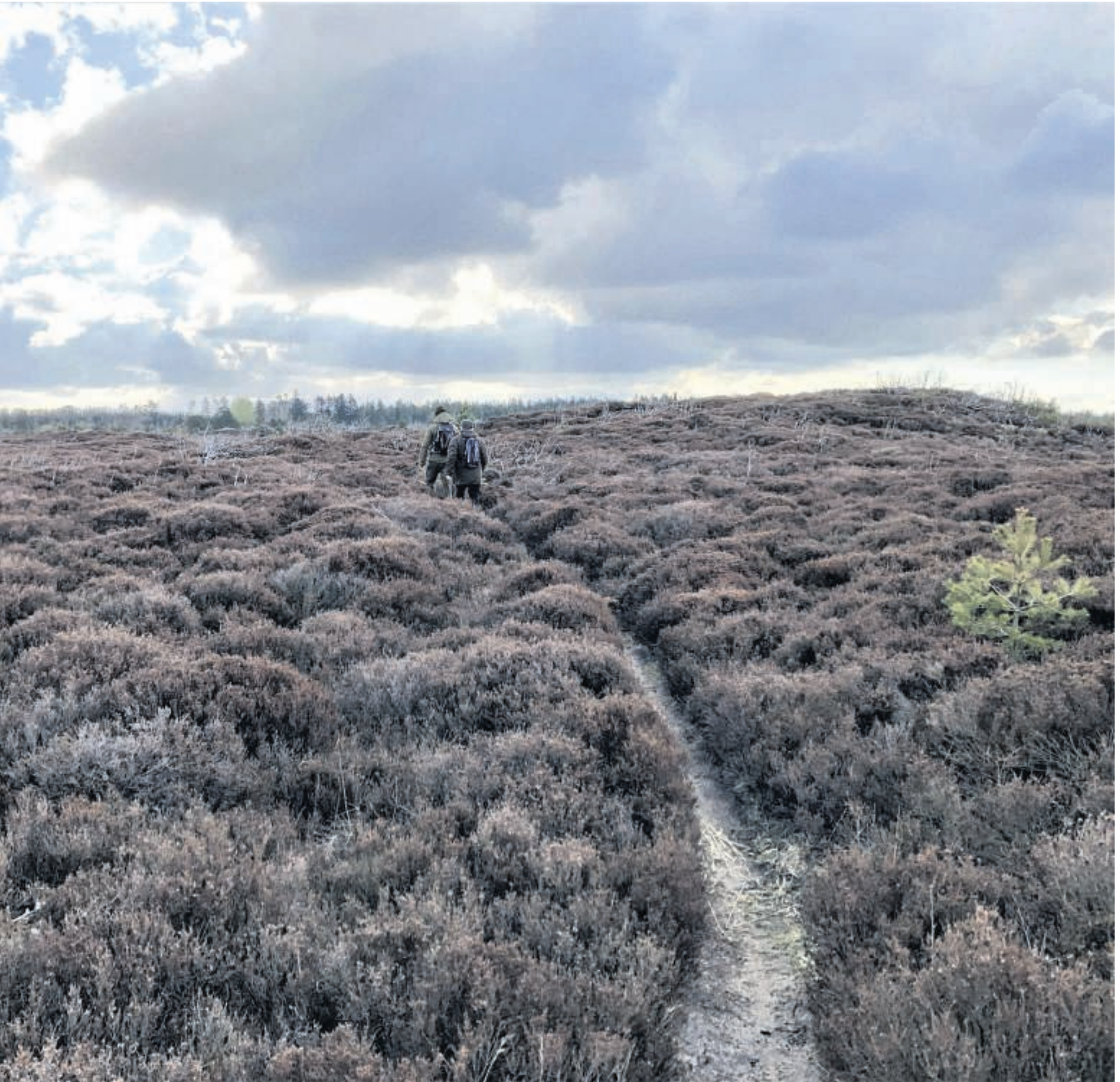
Sønder Vosborg Hede - som i St. St. Blichers tid.

stant skiftende landskab ad Fårefoldvej, skyder genvej ad nogle unavngivne skovveje, og ender ude på Sandvej.