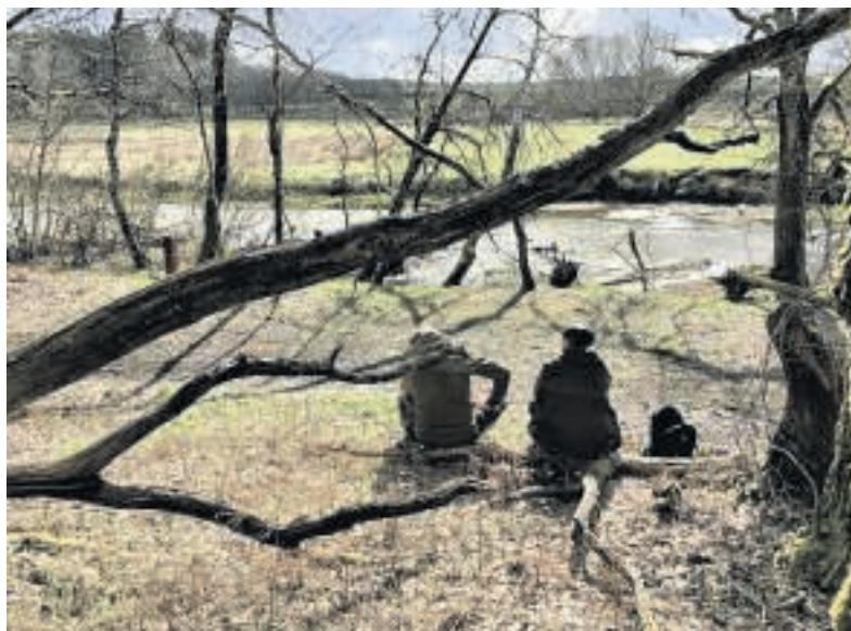
Et smukke sted til et hvil og en kop kaffe kan man ikke tænke sig.