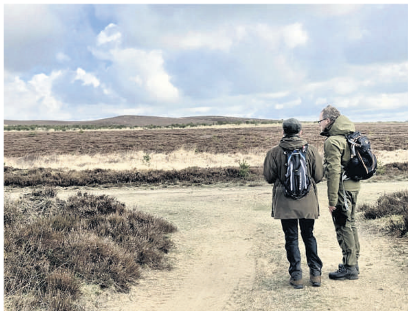
Stråsøs "brune hjerte" - det store hedeområde midt i naturnationalparken.

Du behøver ikke tage ret langt væk for at opleve en enestående natur. I grænseområdet mellem Ringkøbing-Skjern, Holstebro og Herning finder du den kommende naturnationalpark i Stråsø. Den kan sagtens konkurrere med de bedste vandreamråder i ind- og udland.