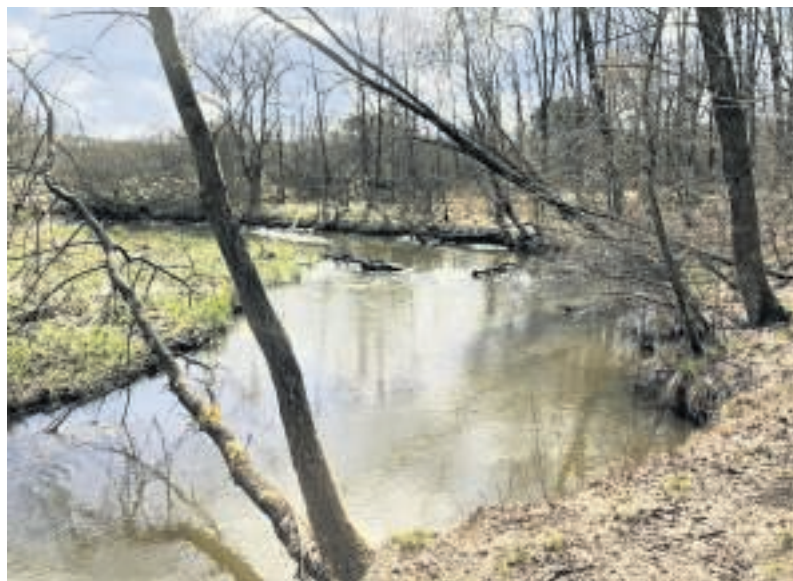
Lilleå behøver ikke blive "rewilded", som det hedder, når naturen får lov at passe sig selv. Der er allerede helt sig selv.