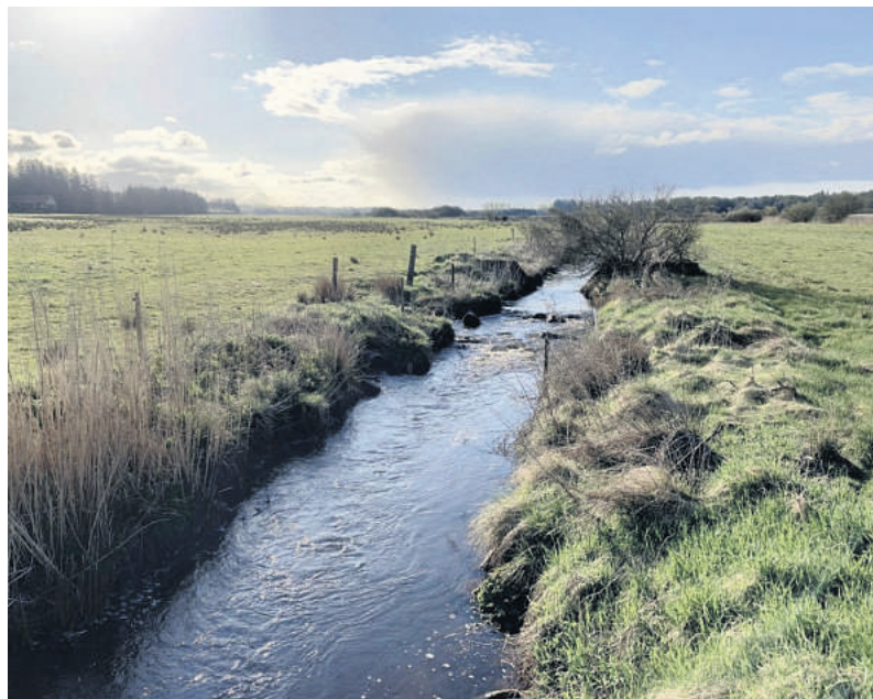
Den hurtigtløbende Madum Å, grænsen mellem Holstebro og Ringkøbing-Skjern Kommune.