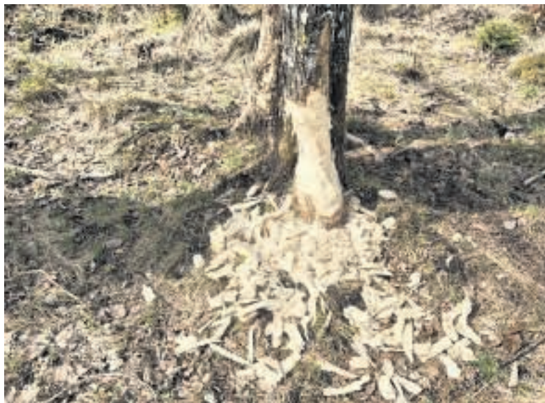
En bæver på arbejde! Er der mon en bæverdæmning på vej ved Lilleå?