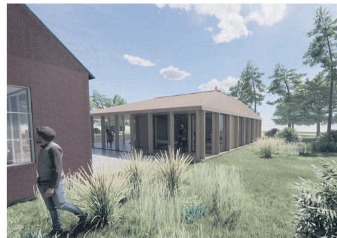
Ombygningen vil koste i alt 4,75 millioner kroner. Visualisering: Kronhede Lejrskole

glade for, at kommunen og VKR-gruppen bakker op om os.