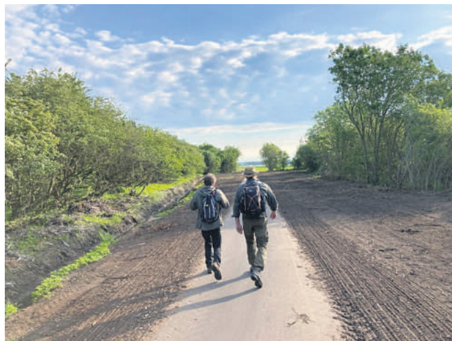
På vej ud af byen ad den nye sti til No. Det bli'r en god dag!