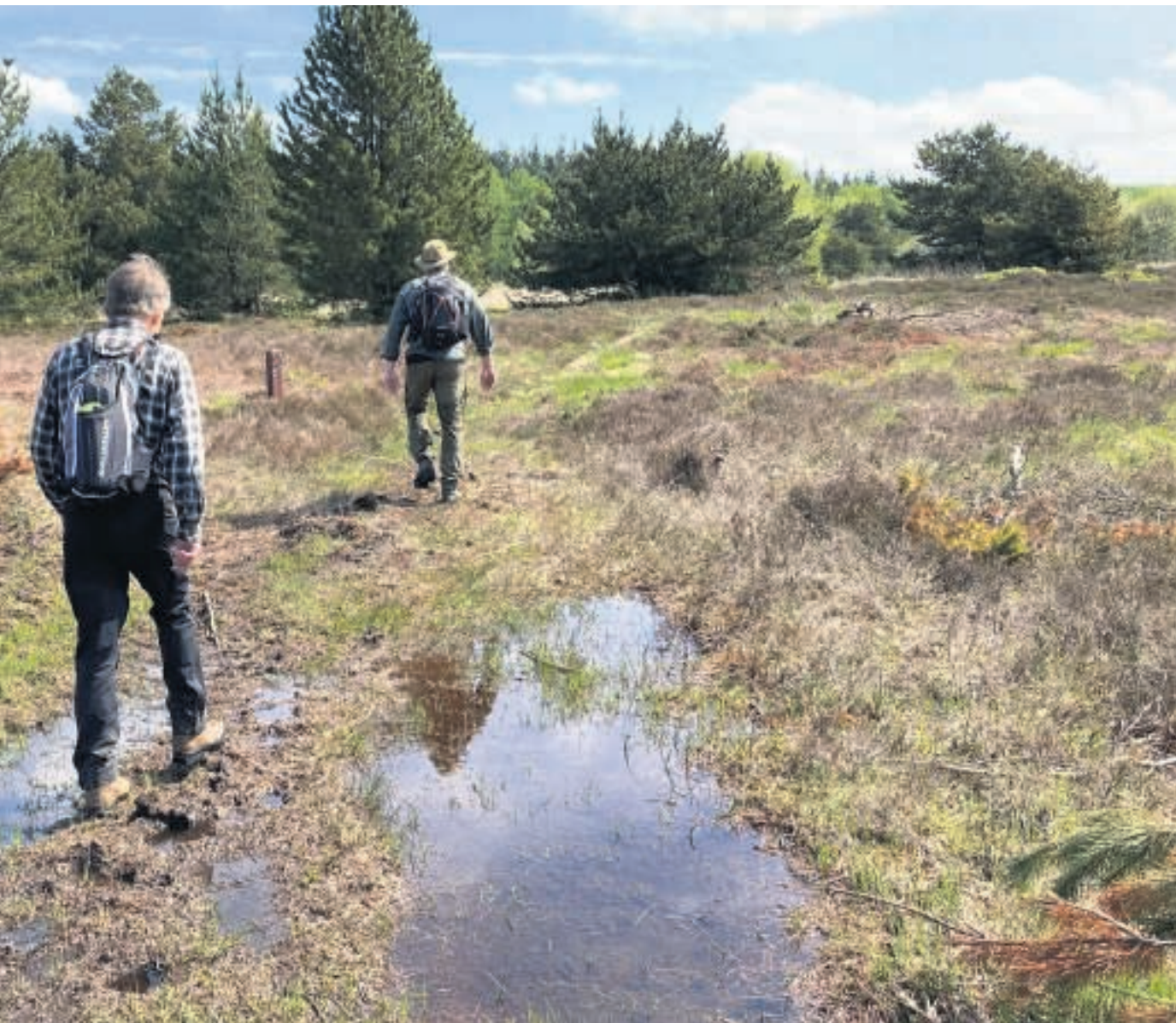
Det er temmelig vildt nogle steder i Hoverdal!