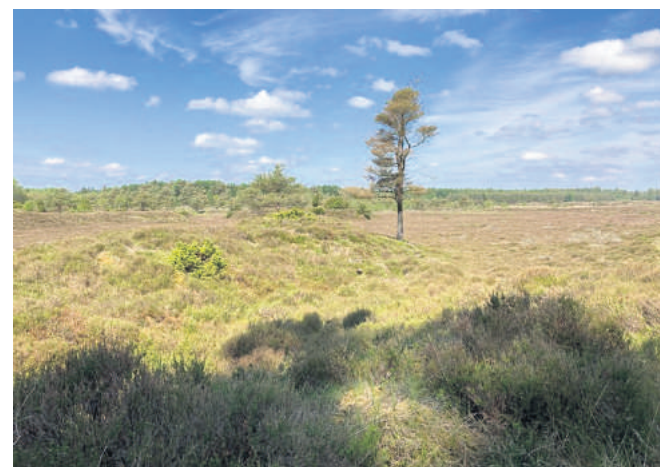
Heden er som en ørken på en hed sommerdag.

Den godt 30 kilometer lange rute har jeg i al ubeskedenhed lagt - dog ved hjælp af min uundværlige app, Naviki. En fiks sag, der egentlig er lavet til cyklister, men som - hvis man slår mountainbikefunktionen til - sagtens kan bruges til at finde interessante vandreture.