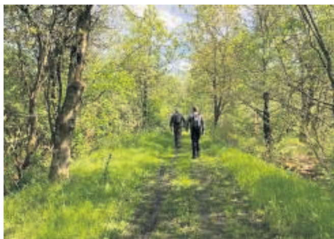
Ruten fører gennem Sandal Plantage.