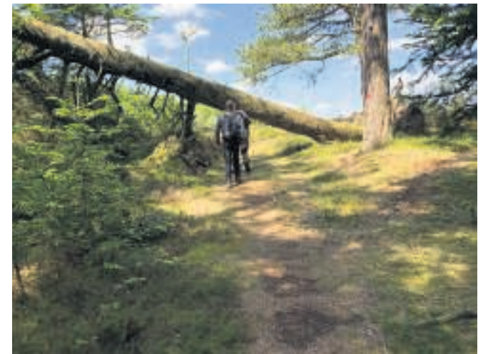
Man møder en del overraskelser i Hoverdal.