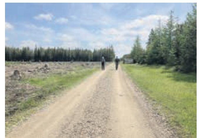
Det kunne lige så godt have været Mellemsverige - men det er Hoverdal.

vores fordør, og hver drejning har budt på nye og ukendte udsigter over kendte landskaber.