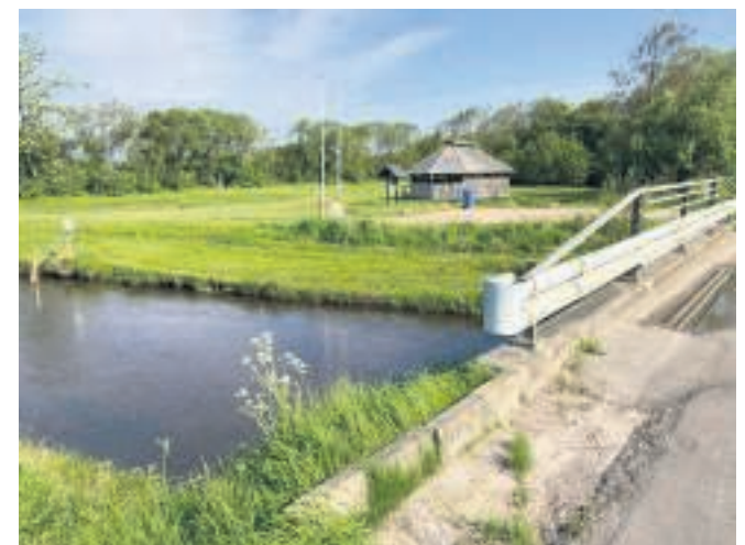
Et godt sted at holde pause: Madpakkehuset ved Hee.