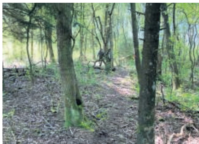
Ad junglestien gennem Hoverdal.