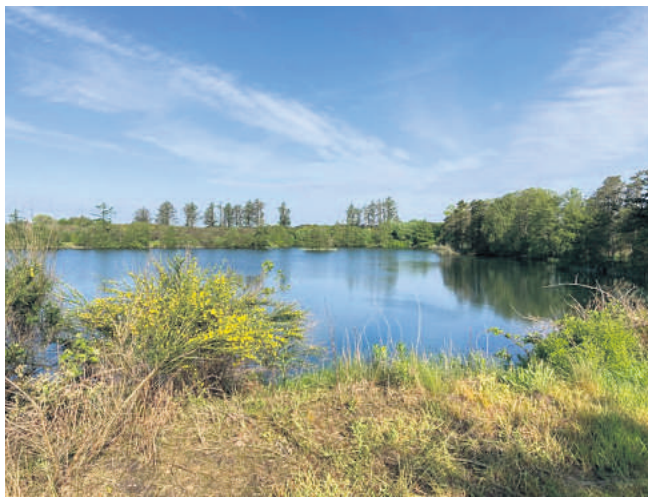
Høvring Sø lidt uden for No.